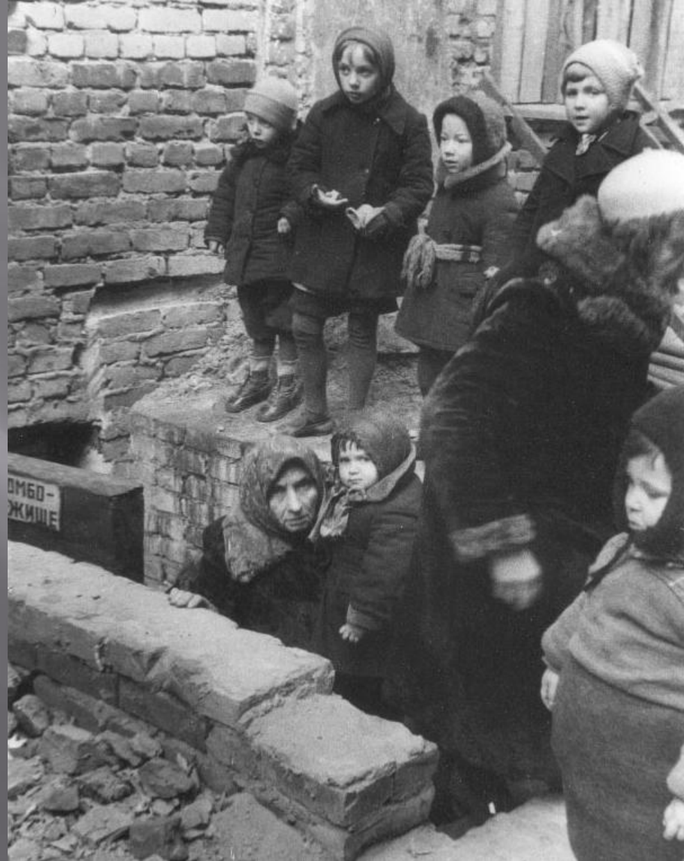
Спасение от обстрелов врага в бомбоубежище